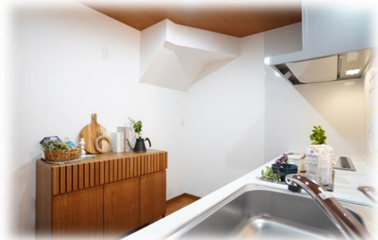
IHクッキングヒーター付 システムキッチン