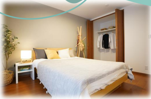
たっぷり収納の寝室