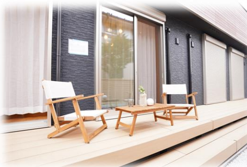
明るいウッドデッキ